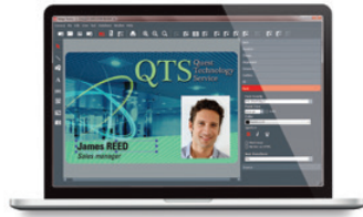
Software de personalización de tarjetas Evolis Badge Studio®+ (incluye la importación desde las bases de datos)