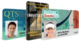
Cartoteca en línea